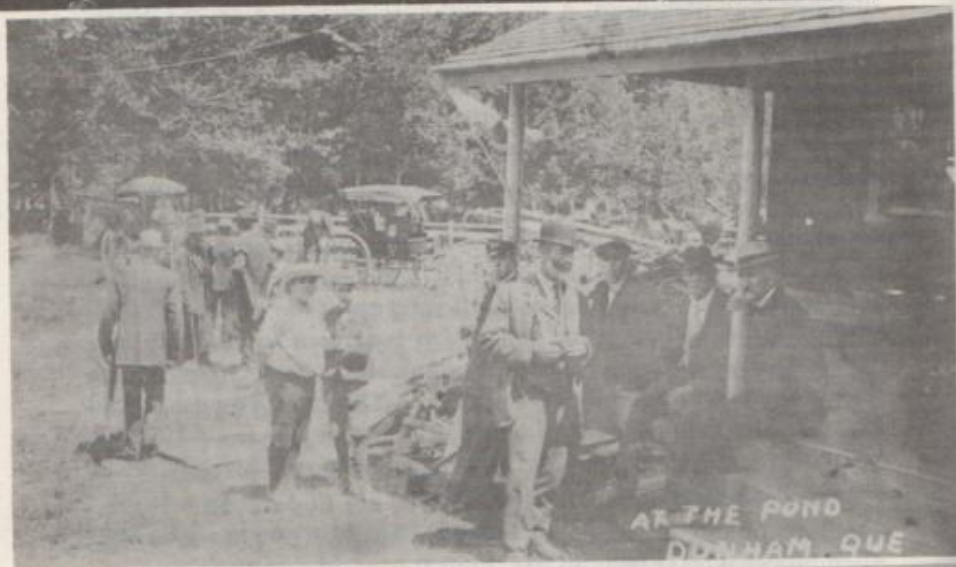
AT THE POND DUNHAM, QUE