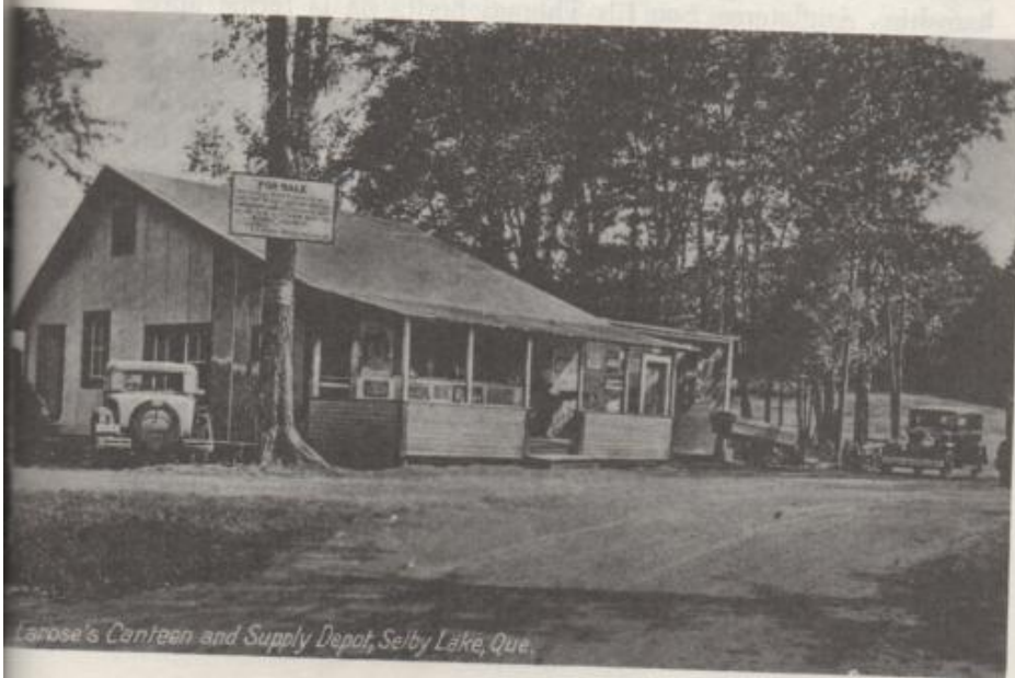
Larose's Canteen and Supply Depot, Selby Lake, Que.