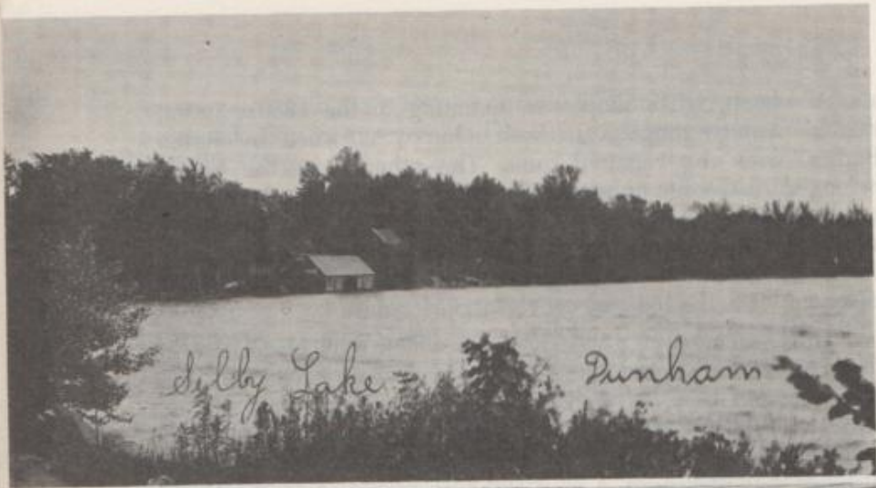
Selby Lake Dunham